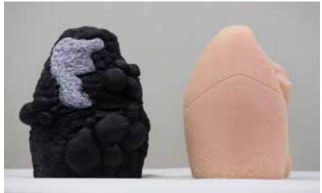
【禁煙指導用肺セットモデル】

健康な肺と喫煙者の肺のモデルです。喫煙者の肺には灰白色の癌の塊、肺気腫によってできたスポンジ状の嚢胞を再現しています。