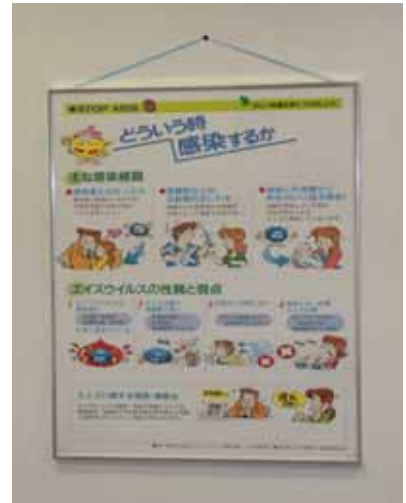
【エイズ予防パネルキット】