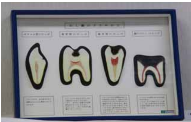
【虫歯の進み方模型】