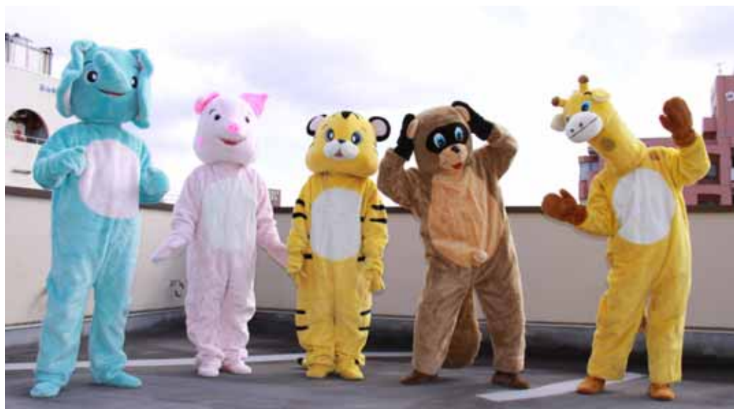
ぞう ブタ トラ たぬき キリン