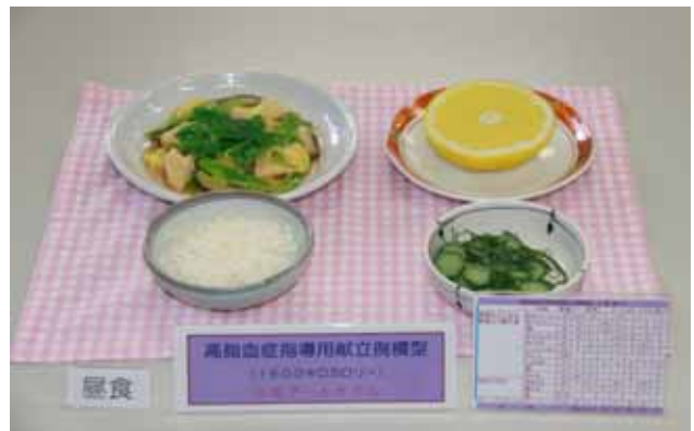
【高脂血症指導用献立例模型(一例)】

糖尿病食品交換表(第六版)に基づく1日20単位(1600キロカロリー)の献立例模型です。