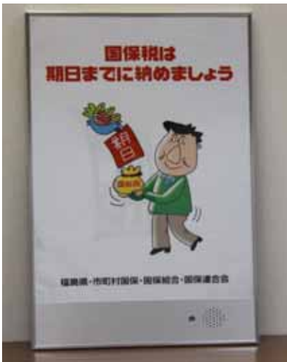
【トーキングポスター】