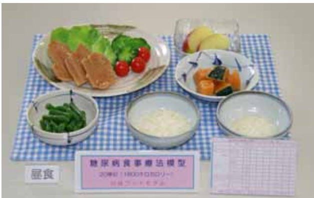
【糖尿病食事療法模型(一例)】

糖尿病食品交換表(第六版)に基づく1日20単位(1600キロカロリー)の献立例模型です。