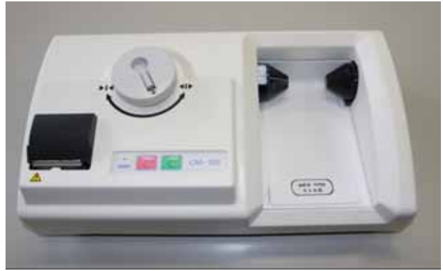
【超音波骨密度測定装置】