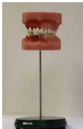
【歯周病予防教育ディスプレイ】