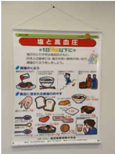
【ヘルスパネル(一例)】