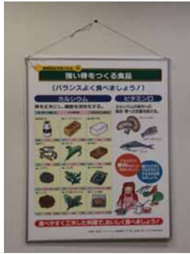
【骨粗鬆症予防パネル】