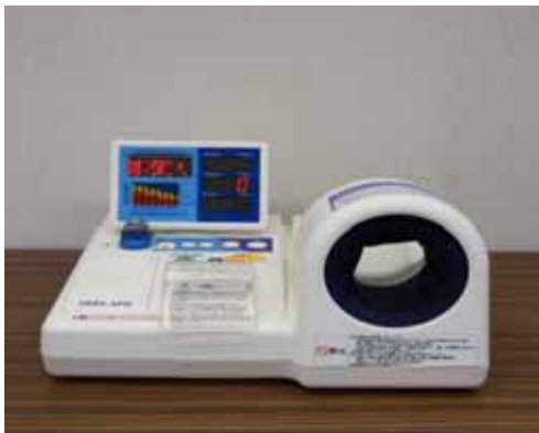
【血行測定機能付き全自動血圧計】