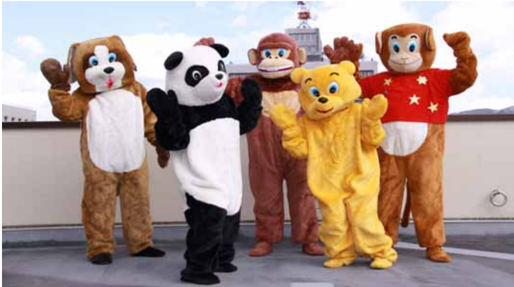
いぬ パンダ ゴリラ くま さる