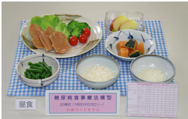
【糖尿病食事療法模型(一例)】

糖尿病食品交換表(第六版)に基づく1日20単位(1600キロカロリー)の献立例模型です。