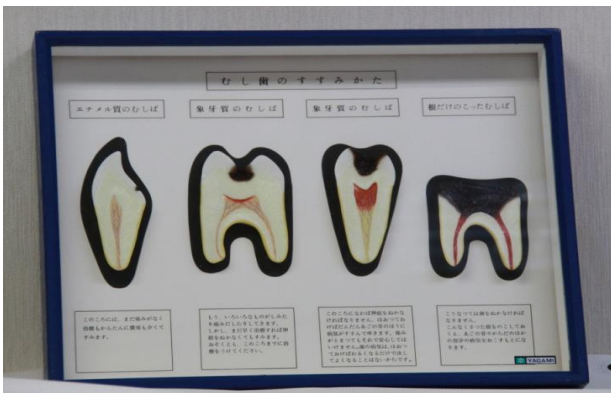
【虫歯の進み方模型】