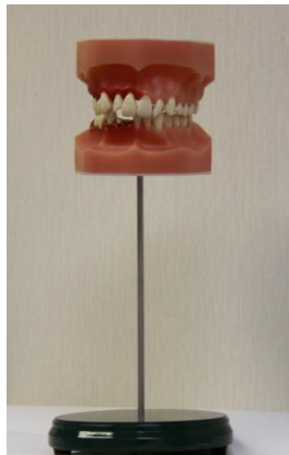
【歯周病予防教育ディスプレイ】