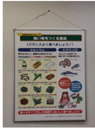
【骨粗鬆症予防パネル】