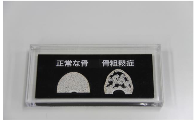
【骨粗鬆症メディカルモデル】