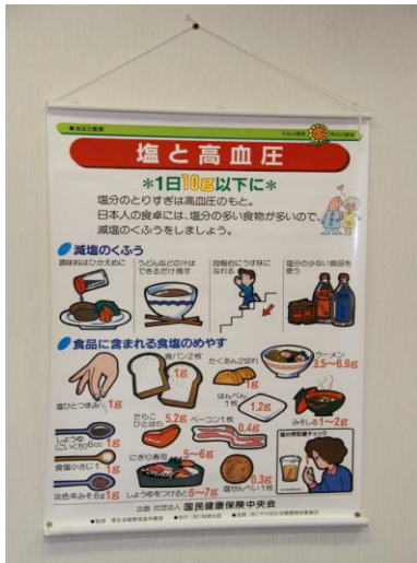
【ヘルスパネル(一例)】