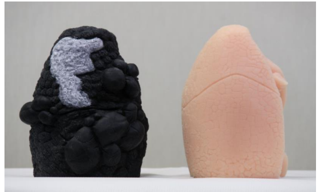
【禁煙指導用肺セットモデル】

健康な肺と喫煙者の肺のモデルです。喫煙者の肺には灰白色の癌の塊、肺気腫によってできたスポンジ状の嚢胞を再現しています。