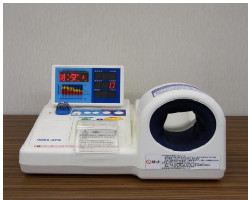
【血行測定機能付き全自動血圧計】