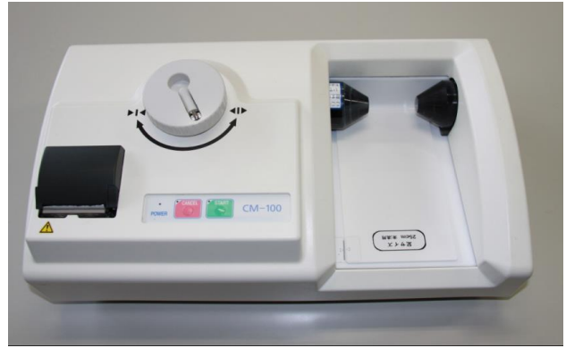
【超音波骨密度測定装置】