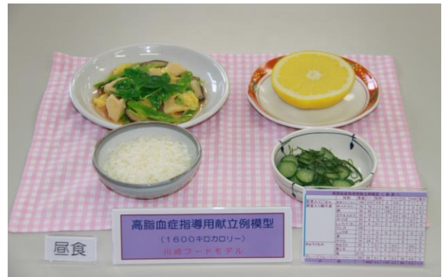
【高脂血症指導用献立例模型(一例)】

糖尿病食品交換表(第六版)に基づく1日20単位(1600キロカロリー)の献立例模型です。